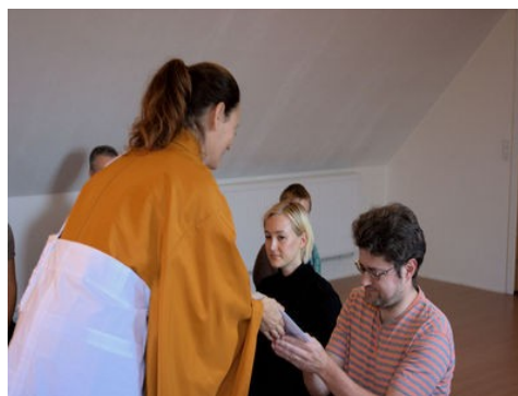
September retreat startede med 4 nye tilflugter